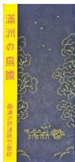
㉕満洲の鳥瞰 南満州鉄道株式会社 五、五〇〇円