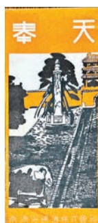
㉖奉天 南満州鉄道株式会社 昭和11年 五、五〇〇円