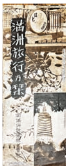
㉗満洲旅行案内之葉 折れ目傷み 南満州鉄道株式会社 五、五〇〇円