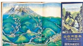
⑬【鳥瞰図】木曾御嶽山 登山探勝案内 千文館原旅館 19×27 昭和4年 5,500円