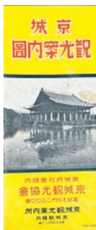
㉘京城観光案内図 折れ目傷み 三、〇〇〇円