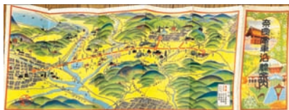
⑳奈良電車沿線案内 20×54 戦前 5,500円