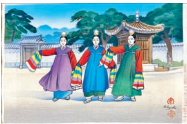
① 京都版画院 朝鮮 日吉守版画 4枚 22,000円